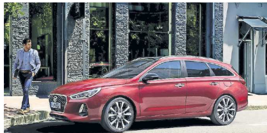
Der i30 Wagon.

Mit uns und Hyundai als Partner fahren Sie einfach noch besser! Wir sind auf die automobilen Zukunft gerüstet. Wir freuen uns auf Sie!