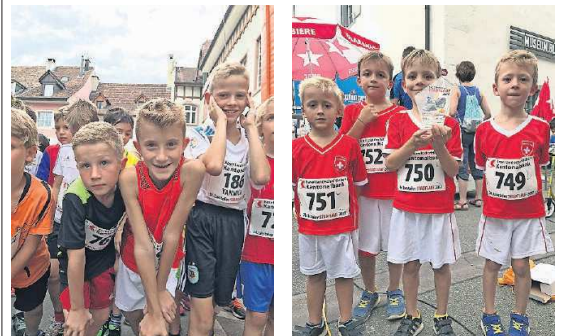
Der Startschuss der U10 fällt in wenigen Sekunden.